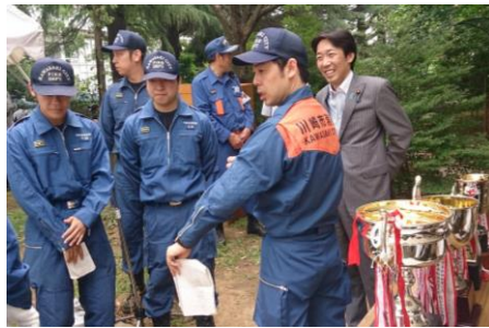
7月14日、第14回多摩消防団消防大会。日々の訓練の成果を拝見させていただく中で、日頃より地域の安心・安全をお支えいただいている消防団の皆様を激励する。