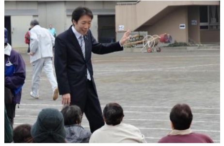
11月3日、中野島連合・大運動会の開会式に参加。あらゆる機会を捉えて、地域の皆様に、いま、政府・自民党が取り組んでいる課題や考え方をわかりやすくお話しさせていただいています。