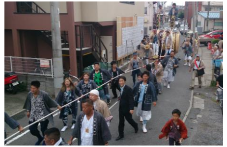
9月8日、登戸稲荷社の秋まつり。台和太鼓会館から出発する曳き太鼓の列に加わる。昨年新調された川崎一の太鼓。地域の絆を手に感じながらの秋の一日。各所のお祭りをまわる。