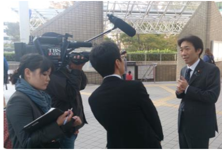
11月1日、TBS「サタデーざっぼと」の取材。川崎市長選挙の結果の原因を探る記者に対して、これまでもこれからも、逃げることなく真摯に地道に有権者と向き合う姿勢の大切さを語る。