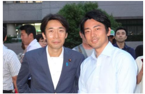
7月5日、新百合ヶ丘駅前に小泉進次郎・党青年局長を迎えて演説会。参議院選挙2日目、島村大候補の応援に入り、日本再生のため、ねじれ国会解消の必要性と新しい自民党をアピール。