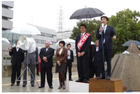
10月20日、新百合ヶ丘にて川崎市長選挙の応援演説。雨の中、自民党推薦のひでし善雄候補の支援を訴える。現職・阿部孝夫市政の継承・発展を目指すも、有権者の理解を十分に得ることは叶わず惜敗。