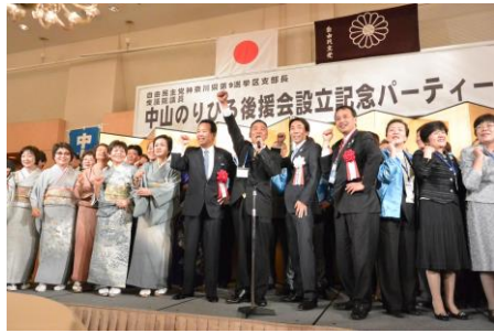
5月8日、中山のりひろ後援会の設立パーティー。甘利明・経済再生担当大臣、参議院選挙への出馬間近の島村大氏他とともに舞台上に並び、自民党躍進、日本復活の想いを込めて氣勢を上げる。