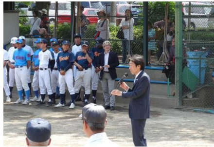
5月26日、麻生区少年野球連盟リーグ戦閉会式にて。子どもたちを育てていくには、地域の絆が欠かせないものであり、スポーツを通して、子ども親も、そして街も素敵な成長を遂げていくことを願う。